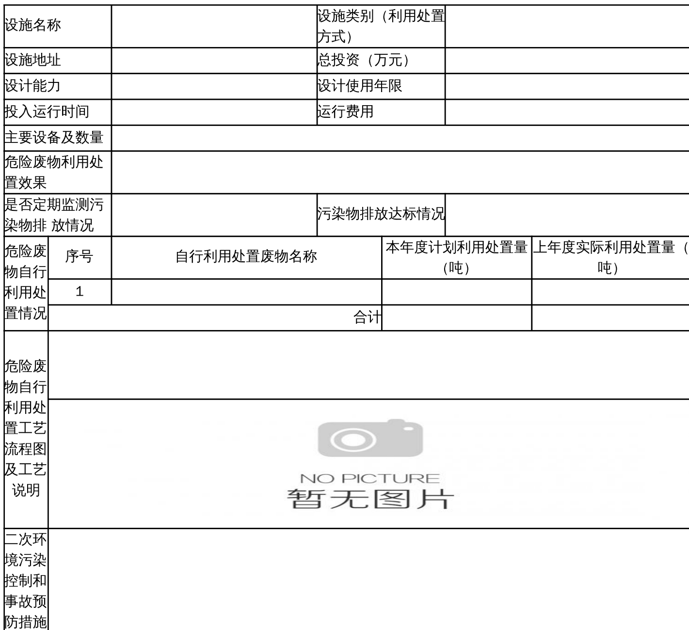
表 7 危险废物委托利用/处置措施（可另增页）